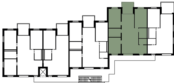
PLAN DE L'ÉTAGE